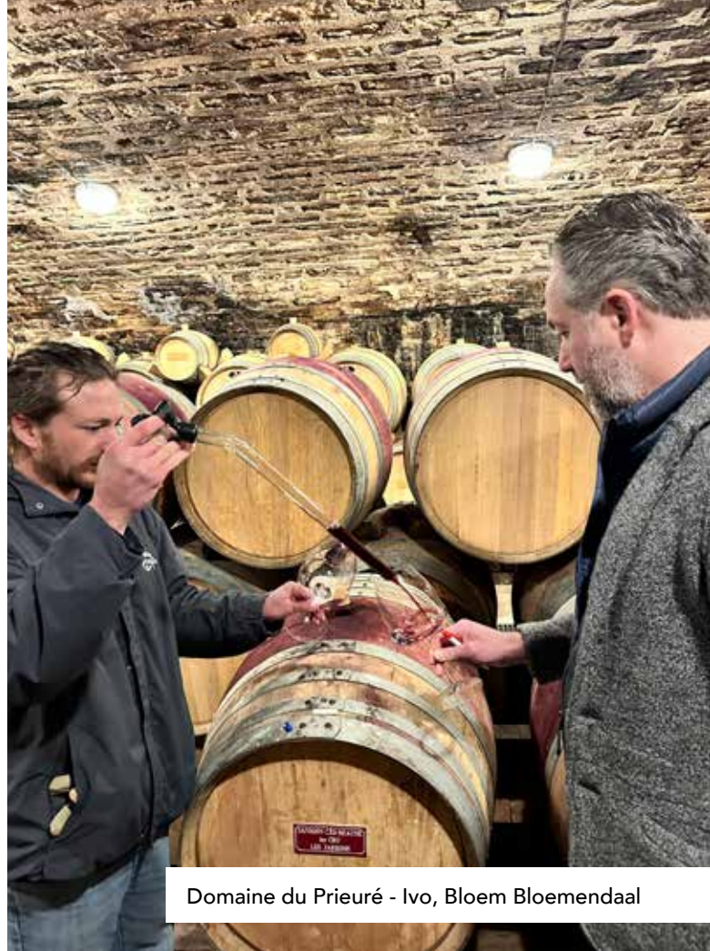
Domaine du Prieuré - Ivo, Bloem Bloemendaal